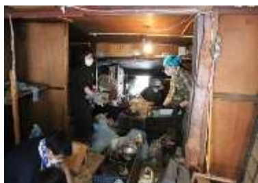
片付けワークショップ