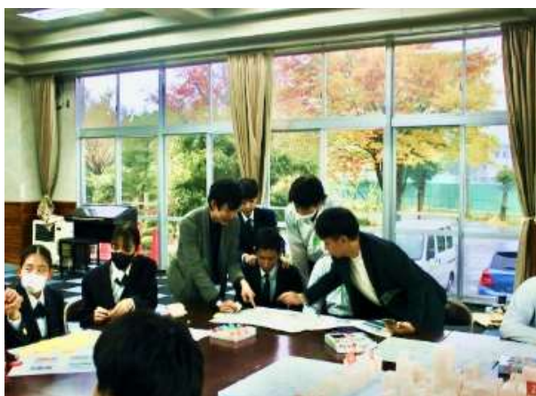
中学生との空き家活用ワークショップ