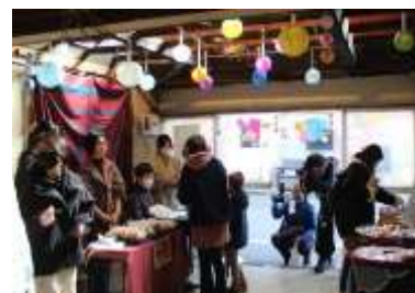
空き家活用イベント