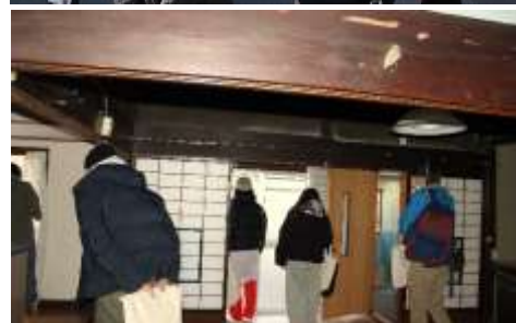
まちあるきや空き家見学会を通してマッチング