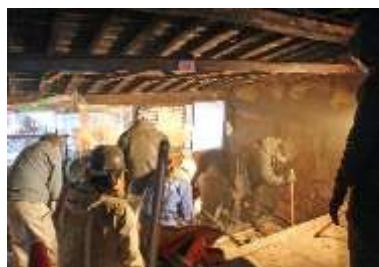
解体ワークショップ