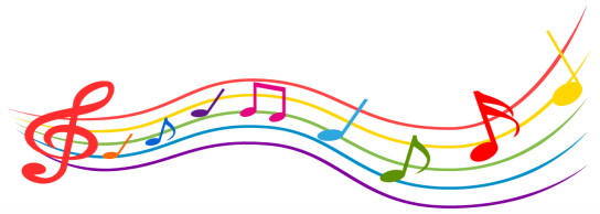
↓ 合唱部 & PTA