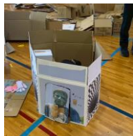
2年生『だんだん だんボール』