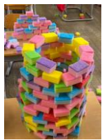
1年生『ならべてつなげて カラフルスポンジワールド』

6月6日、わくわくアートが行われました。学年ごとに多様な材料を使い、工夫を凝らしたアイデア満載な作品が展示されました。この日、上諏訪小学校は素敵な美術館のようでした。