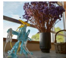
5年生『はさんで つなげて』