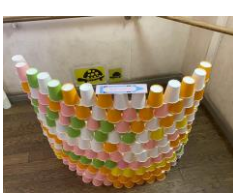
4年生『ならべて つんで カラフルコップランド』