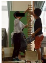
3年生『エンジョイ！カブラ！』