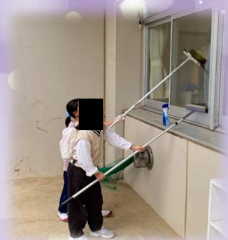
↑ 教室棟窓ふき →

10月4日、秋のPTA作業が行われました。小雨がちらつく中でしたが、約120名の方々にご参加いただき、多くの小学生にもお手伝いしていただいたおかげで学校中がピカピカになり、後期も気持ちの良いスタートが切れたと思います。ご協力いただいた皆さん、ありがとうございました。