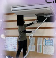
↑ エアコンフィルター掃除