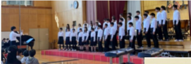
← 上諏訪中学校3年生