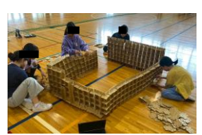
6年生『クミクミックスダンボール』