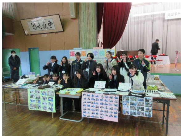
12/20 チャレンジショップ2025より

「こんな工夫をしたんです」とお客さんと笑顔で言葉を交わす姿が見られ、相手を意識したものづくり科の確かな成果が感じられる時間となりました。