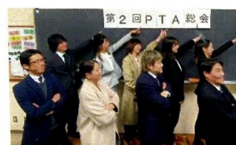
※令和6年度 PTA本部役員メンバー(初期と同じポーズで締めました!)