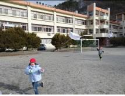
1年 手作り凧あげ 高く上がったよ