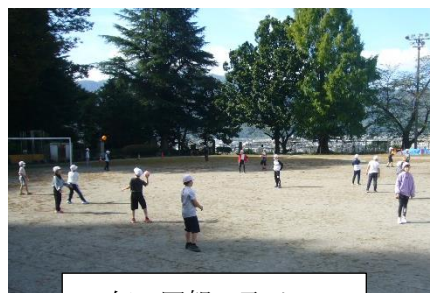
4年 四賀っ子ベース