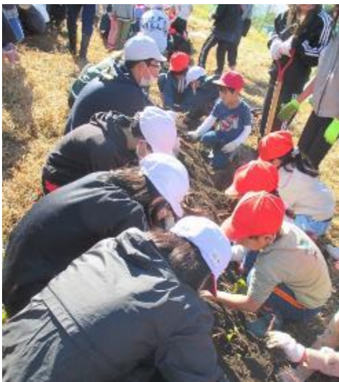
春と一緒に植えたサツマイモも大きく成長し、1・6年生で収穫しました