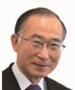
近藤一美議員 （中洲）