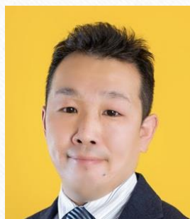
牛山実弦議員 （豊田）