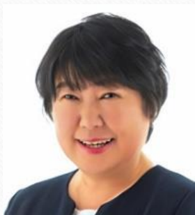
高木智子議員 （高島）