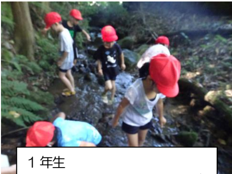
1年生 涼しい！気持ちいい！「川遊び」