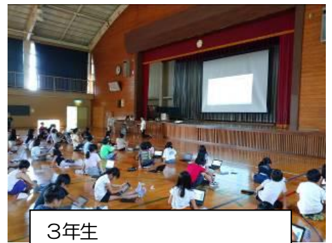
3年生 良い歯を作ろう「歯の講習会」