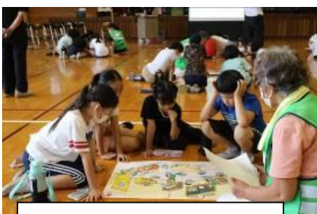
5年生 チームで学ぶ「防災教室」