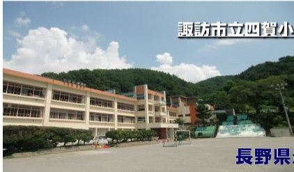
諏訪市立四賀小学校