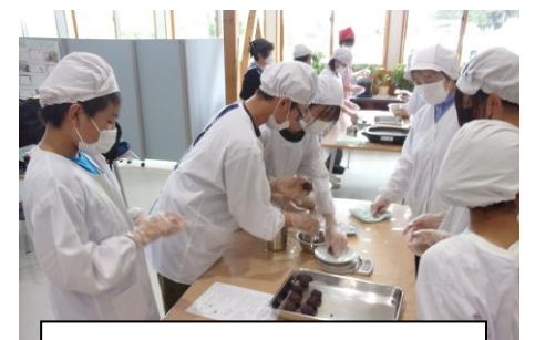
6年生 郷土の料理を知る「おやき作り」