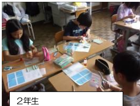
2年生 ものづくり科「しおり作り」