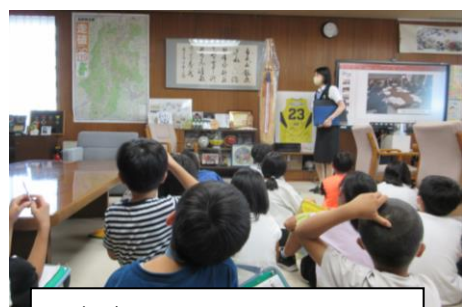
4年生 県庁の動きを知る「長野見学」