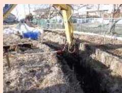
災害防止のための河川改修