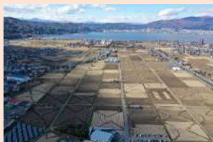
諏訪平土地改良区基盤整備