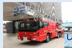
しんきん諏訪湖スタジアム