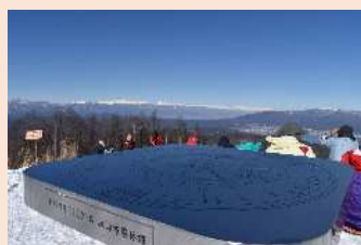
守屋山 山岳方位盤からの眺め