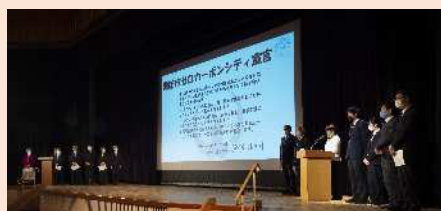
ゼロカーボンシティ宣言