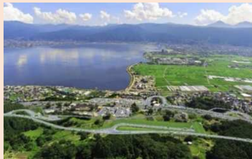
スマートIC完成予想図