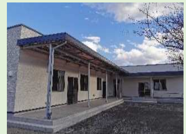
中洲小学校児童クラブ