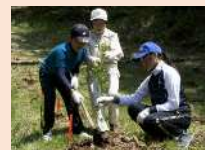
みどりの少年団による植樹