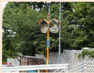
交通安全施設整備