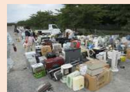
資源物・不燃物の回収