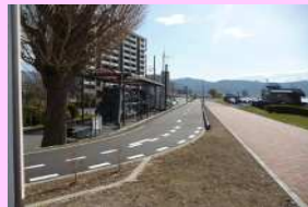
諏訪湖周サイクリングロード