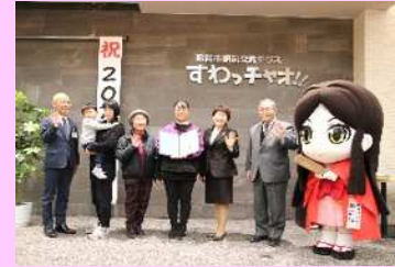
すわ大昔情報センター 国史跡高島藩主諏訪家墓所 駅前交流テラスすわっチャオ