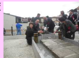
精進湯跡地 お手湯