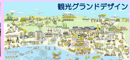
観光グランドデザイン