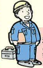
法定検査員 身分証明書を 携帯しています

検査結果書は浄化槽設置者に交付されるとともに、県の地域振興局及び市町村へも送付され、必要に応じ改善指導が行われます。検査結果書で「改善が必要」と判定された場合は、保守点検業者と相談し、速やかに対策を実施しましょう。