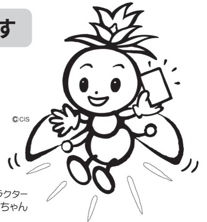
長野県選挙啓発マスコットキャラクター ほたりちゃん