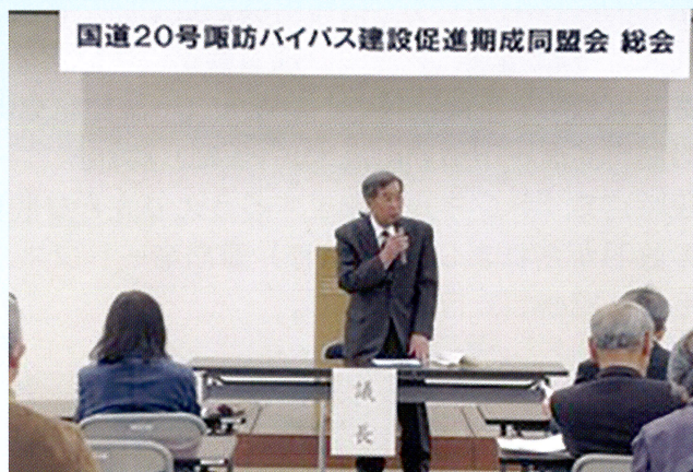
川上新会長の着任挨拶