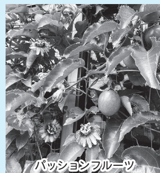
パッションフルーツ