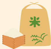
2024年産以降のお米 (白米・玄米)