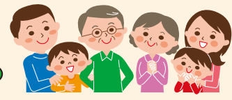
子ども食堂・支援が必要な方