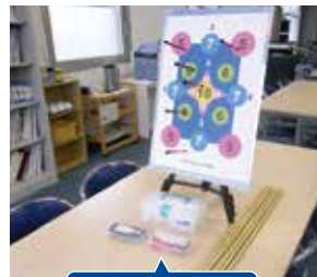
⑨マグネット吹き矢