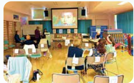
カラオケ会の様子

地区社会福祉協議会を略して「地区社協」と呼んでいます。諏訪市には、大和・湯の脇・山の手・東部・南部・小和田・豊田・中州・湖南の9つの地区社協があります。