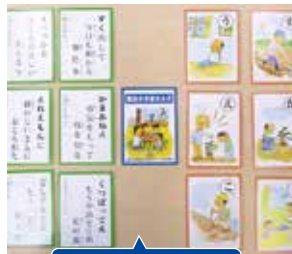
④諏訪の方言カルタ