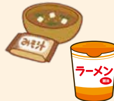
インスタント食品