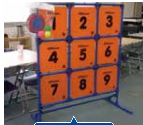
⑧ディスクゲッター