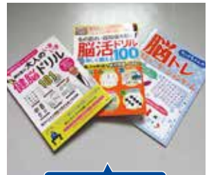
⑬脳トレ・脳活ドリル