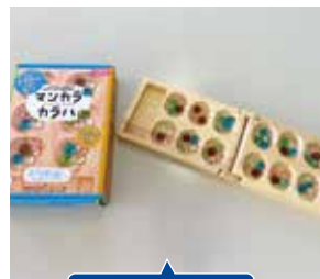
⑯マンカラ・カラハ