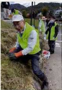
春には水銃が満開