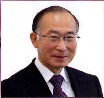
諏訪市議会 社会文教委員会 委員