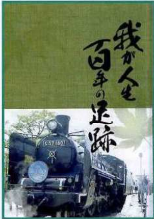
自叙伝「我が人生 百年の足跡」

人生100年時代と言われていますが、全ての方が健康で長生きできる訳ではありません。ハッピーサロンでは今現在も社会に貢献し、元気で活躍されている高齢者の方々に、どのように実践されているのか語っていただき、皆さんで参考にします。又、参加者全員の皆様からの体験談をお話していただきます。