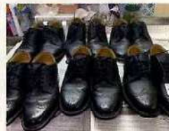
リーガルの愛好者連絡を!

俳句...元旦や諏訪湖一周八十二 路の薑味噌汁に入れ母の味 下萌えや命の息吹そこかしこ 川柳...美味なれど外国産だ浅蜷汁