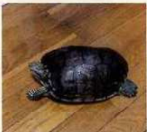
亀飼っている方連絡を!