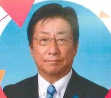
講師：川上文浩 可児市議会議員