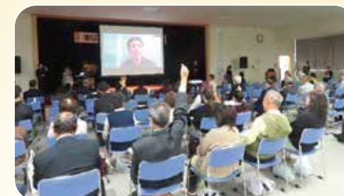
令和7年度社会福祉大会

「社協だより」、ボランティア・市民活動情報誌「花の輪」を発行し、社協が取り組んでいるさまざまな福祉推進活動や、市内各地区の取り組みなどを紹介しています。また、社会福祉大会を開催し、福祉活動に貢献された方々の表彰、講演会等を行い、社協が進める福祉のまちづくりについて啓発活動を行っています。