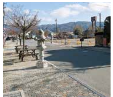
博物館周辺と北参道

問 主な意見は、 答 無電柱化をはじめ博物館周辺での多目的広場の整備事業や、相撲場としての土俵の移設、空き家の対策と活用など賑やかな街なみの形成につながる取組について意見があった。 問 これからの取組の考えは、 答 令和8年度には、この整備方針を基に、第1期として優先的に実施する事業内容や、民間の建物への景観助成制度の枠組みなどについて定める、街なみ環境整備事業計画を策定する予定。長期にわたる取組となるが、地域の皆様とともに進めていく。