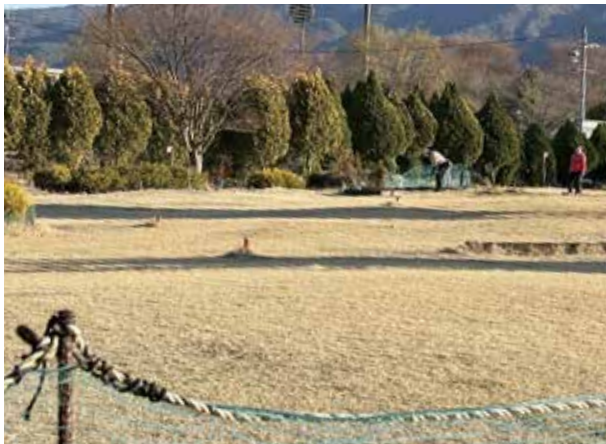
マレットゴルフは健康長寿に最適

答 例年同様に事前の整備を行うとともに、開場後も草刈りやコースの補修など、既存予算を活用しながら、利用者の皆様に安全で快適な環境を提供できるよう、維持管理に努めていく。