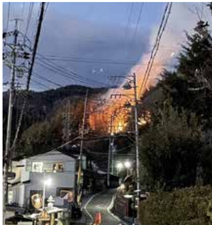
四賀桑原の林野火災

答 消火水利の充実に加え、消防団の迅速な参集、地域住民による道案内や交通整理等の協力が早期収束