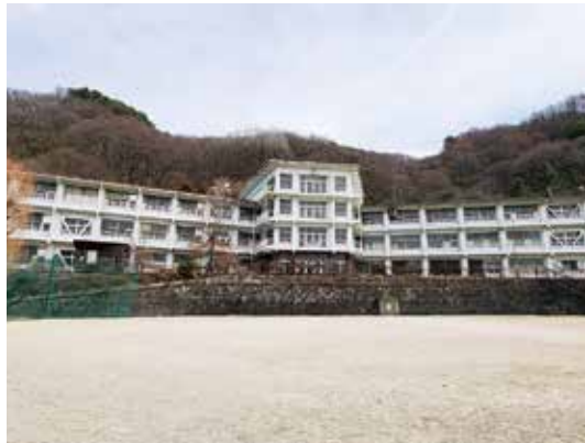
解体予定の旧城北小学校

答 チョイソコかりんちゃんの予約方法は、電話とネットの2つの方法。電話予約、高齢者にも丁寧な対応を心がけ、負担軽減に2割引のプリペイドカードを導入。定額乗車券や年間パスポートの導入も、ニーズ把握し、検討を進めていく。