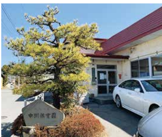
新園舎への移転建て替えが検討される中洲保育園