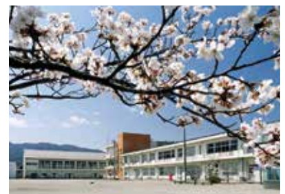
小中一貫校予定の諏訪南中学校

答 1. 中学校区ごとに小中一貫校を定め、小中共有目標を定める。 2. 中学校区ごとに「ゆめスクールチャレンジ」を定め、研究テーマを教職員が定め、学校改革を先導する。 3. 教育委員会が、校長の裁量で使える補助金を支給し、教育視察や専門家を招いた研修などを行っている。 4. コミュニティスクールの学校運営協議会の共同設置が進められている。 諏訪市では、新しい時代の教育を志向し、そろえる教育から伸ばす教育への転換を掲げて学校改革に取り組む中、小学校と中学校の接続に起因すると考えられる様々な課題解決のための取組をしている。