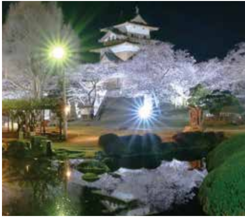
ライトアップされた高島城

答 樹木管理については、剪定作業等を専門業者に委託し、樹種や生育状況に応じて適切な時期に必要な手入れを行っている。観光誘致の取組として、開花に特化した情報をシーズン中は市ホームページにおいて毎日発信している。加えて毎年、桜の夜間ライトアップを実施している。