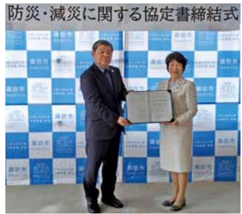
一般社団法人日本RV協会との災害協定の締結式

問 協定締結の目的は、 答 応援職員を含めた自治体職員や医療介護者の宿泊場所、避難者の移動可能な避難シエルターなどとして、市内の被害状況に応じて様々な用途で支援活動を行うことを目的としている。 問 キャンピングカーの平時の活用と災害対応車両として登録する制度の取組は、 答 平時と災害時における両面での活用という視点は、市民サービスの向上と災害対応力の強化を両立させる上で、大変意義深いものと捉えている。しかし、まずは協定締結に基づき、災害時におけるキャンピングカーの活用を積極的に進めていく。