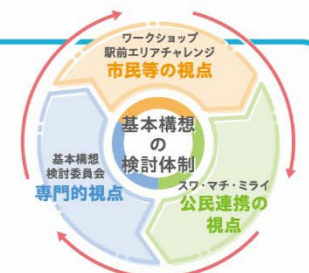
三位一体の検討体制イメージ

なお、今後は本構想に基づく西口駅前広場整備を行い、2030(令和12)年度末の供用開始を目途に進めていきます。