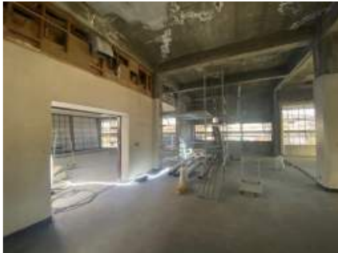
エレベーター設置箇所