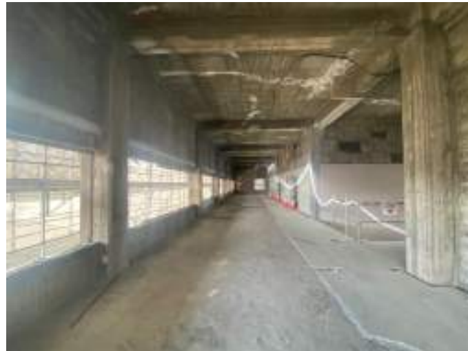
楽屋・フリースペース