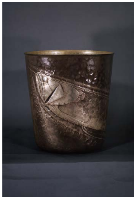
浜達也《淡水の幻》昭和49年（長野県立美術館蔵）