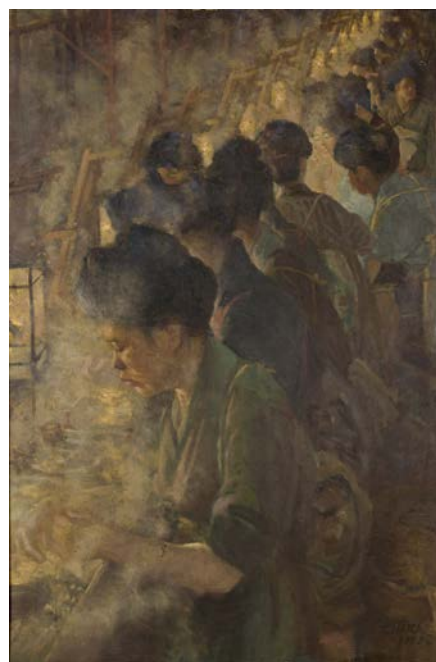
原輝美《製糸工女》大正2年（諏訪市美術館蔵）