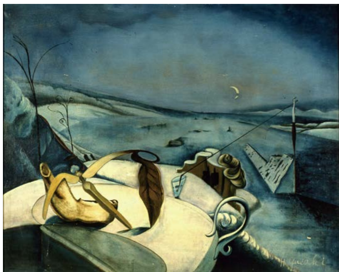
矢崎博信《高原の幻影》昭和13年（諏訪市美術館蔵）

距離にしておよそ100km。普段は離れた位置にある二つの美術館と、それぞれの作品が交じり合った展覧会を、ぜひご覧ください。