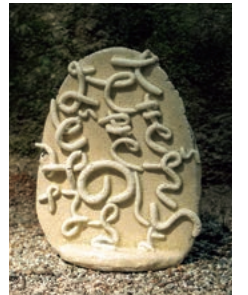
《適材適所の藪みなさ》2024年