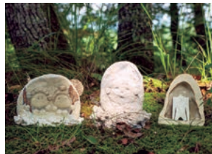
《風雷坊》・《頭足人》・《元気健康》2024年 《心心》2024年