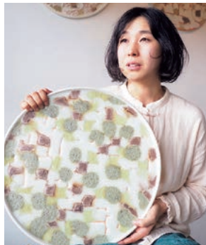
「路傍のかやみぎやみ」シリーズ