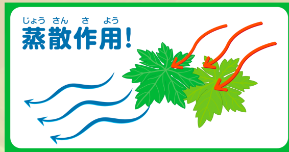
【理科で学んだ蒸散作用】

奪うことで葉の温度上昇が抑えられます。みどりのカーテンは日陰をつくるだけではなく、室内への放射熱も抑えてくれます。