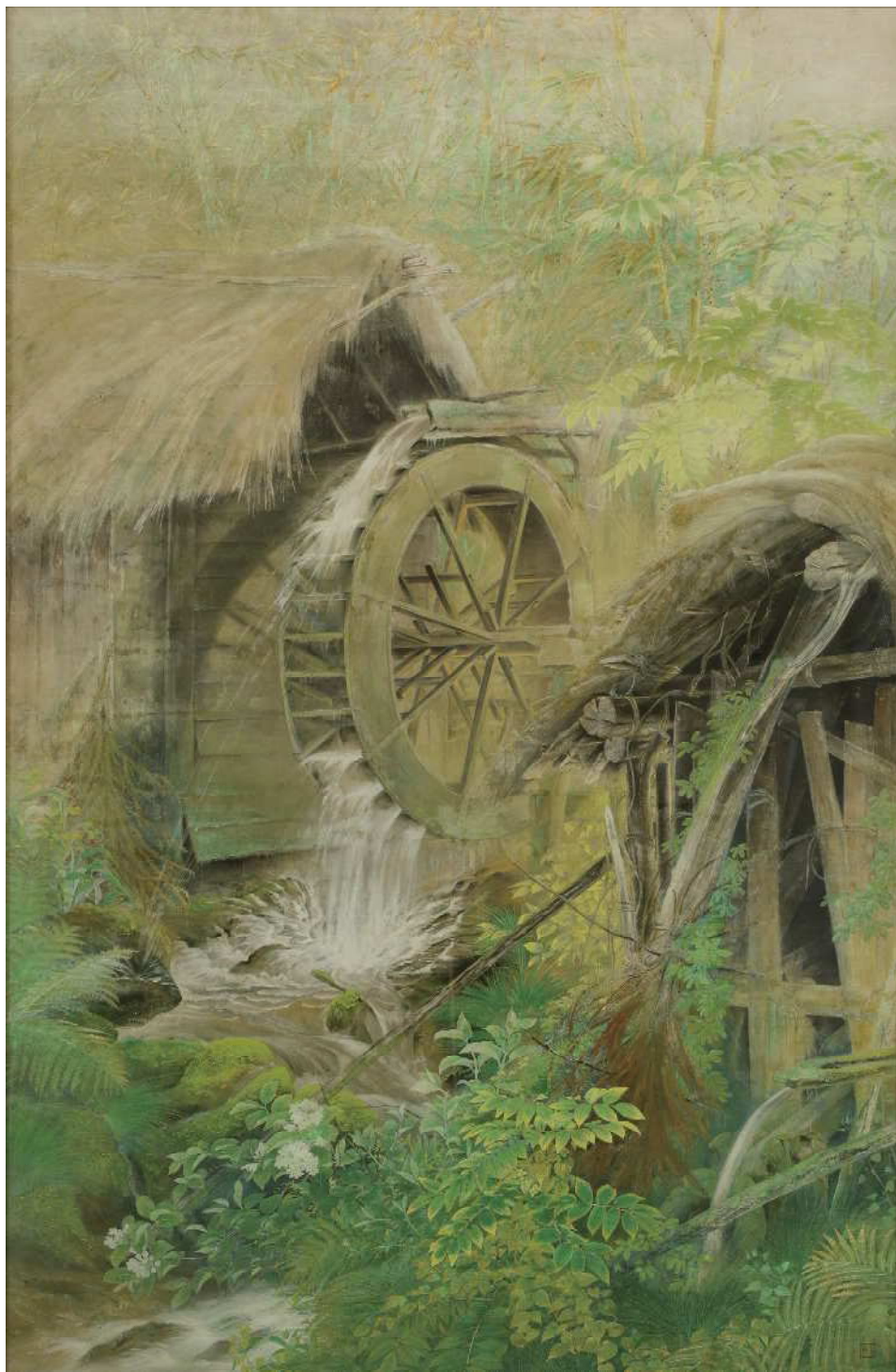
藤森青芸《水車》1934（寄託）