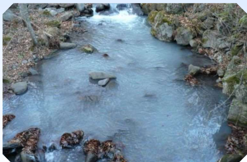
重油流出事故の様子

油や農薬などが河川へ流出してしまったり、水質の異常によって魚が死んでしまったりする「水質汚濁事故」が多発しています。