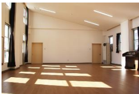
④「多目的ルーム」 ♪軽運動もできるよ！