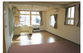
⑥「親子ふれあいルーム」 ♪乳幼児親子優先の部屋だよ！