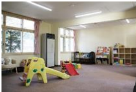
②「多世代ふれあいルーム」 ♪いつ来ても使えるよ！