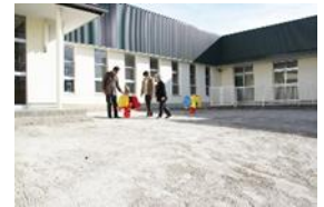
⑤「中庭」 ♪いつでも使えるよ！