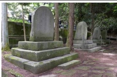
国史跡 高島藩主諏訪家墓所(温泉寺)

〒392-0015 長野県諏訪市中洲 171-2 (諏訪市博物館内) 長野県 諏訪市 教育委員会事務局 生涯学習課 文化財係 (担当) 中島・日野 電話 0266-52-8522 FAX 0266-52-6990 メール shougaku@city.suwa.lg.jp