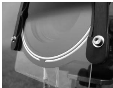
ヒーティング有り