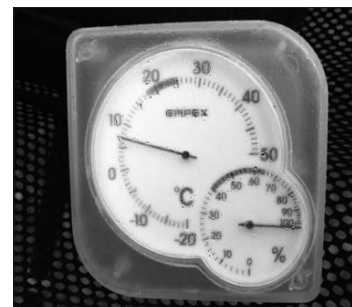
テスト環境時の温度・湿度