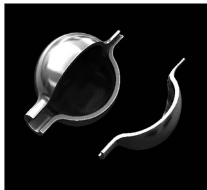
拡散接合中空部品 (切断品)