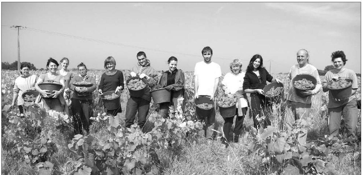
グループ会社 ドメヌ・ドゥ・ラ・セネシャリエール(フランス)の葡萄畑