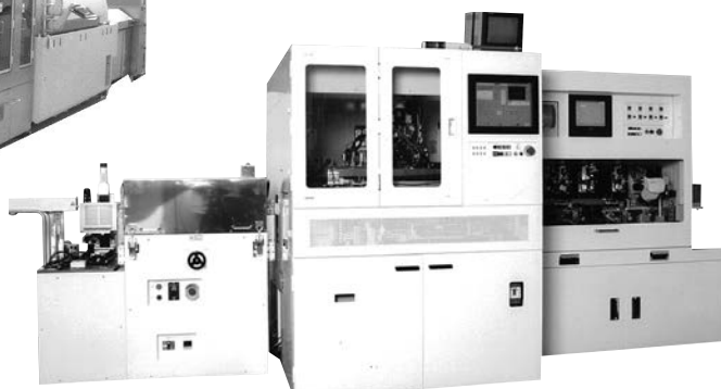
超音波ボンダー+アンダーフィル