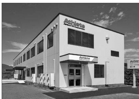
2022年8月 第2工場、稼働開始 物品手配・仕分けの物流拠点を移転

半導体産業をはじめとする産業ユーザーの期待にお応えして、量産から試作、研究に最適な半導体実装装置、組立装置などを提供し、めざましい進化を続けるマイクロエレクトロニクス技術に対応しています。