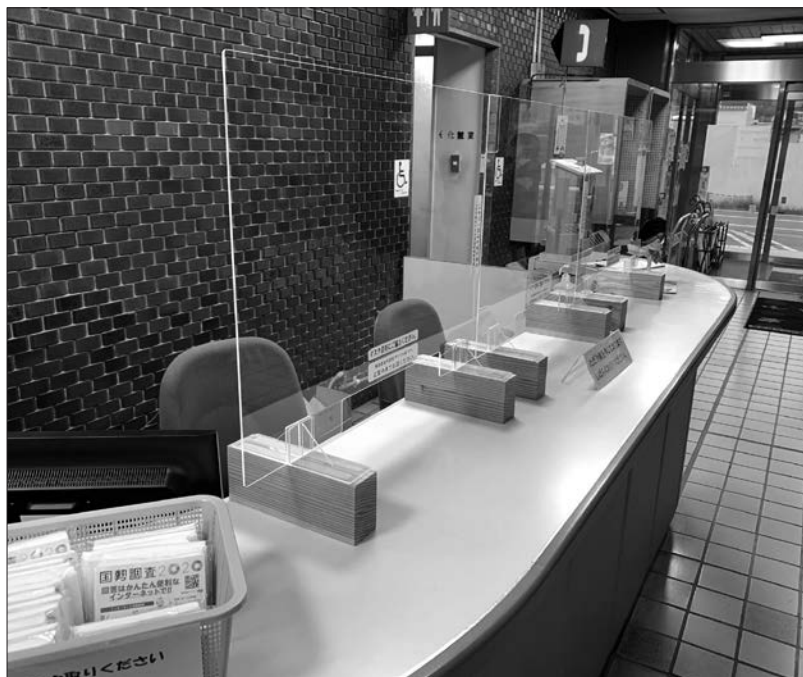
飛沫感染防止パーテーション

(URL) http://www.enforte.net/ (E-mail) info@enforte.net