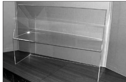
商品用ディスプレイ棚