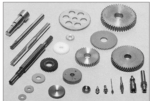
小和田工場製品例