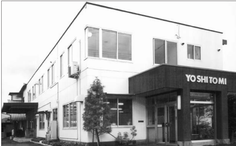
湖南本社 (湖南工場)