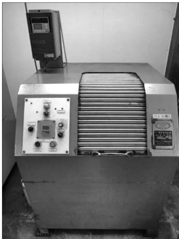
遠心バルレル研磨機