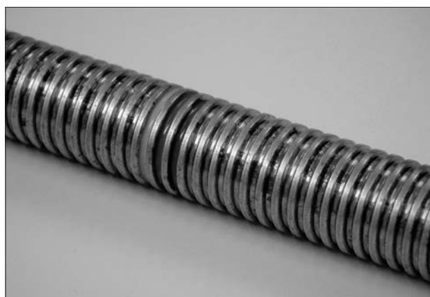
①リード角ゼロのアルキ転造