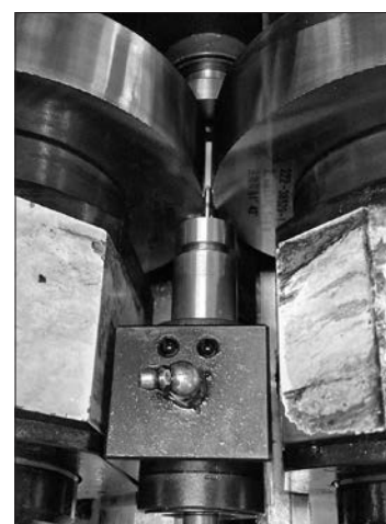
②部品のアルキ転造