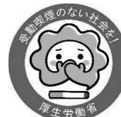
受動喫煙防止に向けた取組