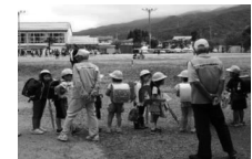
児童の登下校を見守る 「キョロプラ運動」