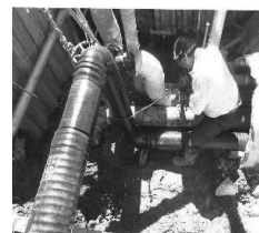
温泉管布設替工事