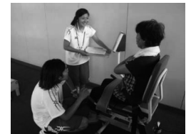
健康づくりプロジェクト