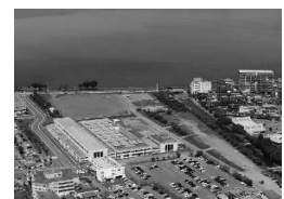
諏訪湖イベントひろば