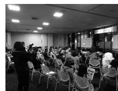
駅前交流テラスすわっチャオ イベントの開催