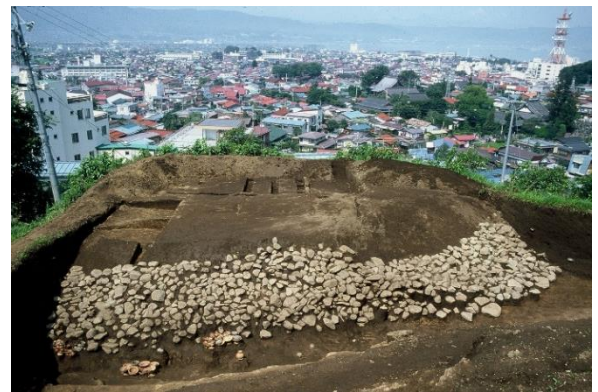
一時坂古墳(諏訪市元町) 昭和57年発掘調査

そこで今回は、上諏訪地区で昭和57年に発掘された「一時坂遺跡(古墳)」と昭和59年に発掘された「大ダッショ遺跡」を取り上げ、発掘時の“生々しい”スライド写真を見ながら、当時の発掘担当者と当館学芸員がその意義について語り合います。謎が多い上諏訪の弥生～古墳時代について、解明へのヒントが見いだせれば幸いです。