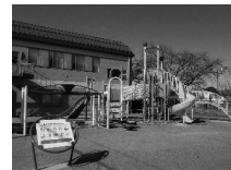
沖田公園の複合遊具