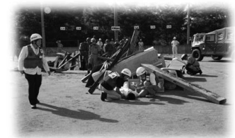
地域における防災訓練