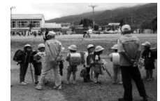
児童の登下校を見守る 「キョロプラ運動」