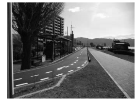
諏訪湖周サイクリングロード