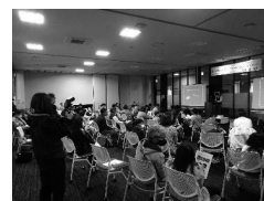
駅前交流テラスすわっチャオ イベントの開催