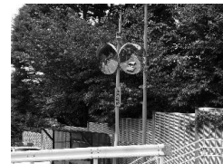
交通安全施設の整備