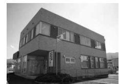
小児夜間急病センター