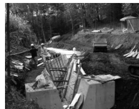
災害防止のための河川改修