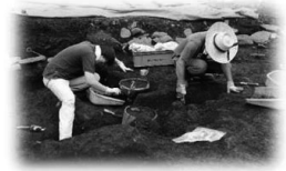
市内における発掘調査