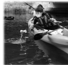
カヤックでのごみ回収