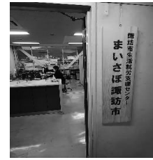
諏訪市生活就労支援センター 「まいさぼ諏訪市」