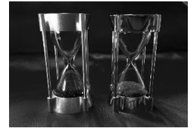
SUWAプレミアム認定商品