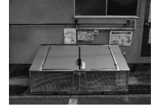
ごみステーション整備