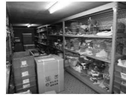
諏訪市博物館収蔵庫