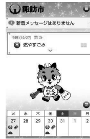
ごみ分別推進アプリ「さんあ〜る」