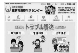
諏訪市消費生活情報サイト