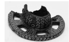
小丸山古墳出土金属製品