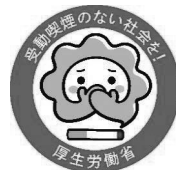
受動喫煙防止に向けた取組