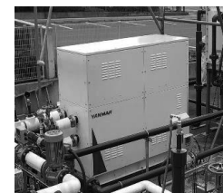
温泉熱発電実証実験