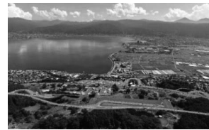
スマートIC完成予想図