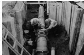
水道管布設替工事