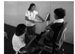
健康づくりプロジェクト