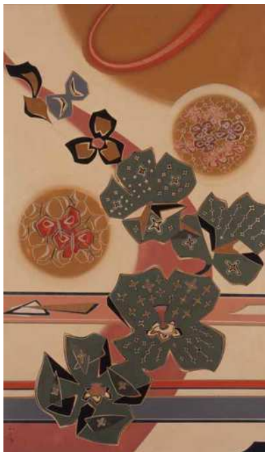
小口正二《星に省る花》1969年 諏訪市美術館蔵