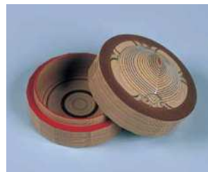
音丸耕堂《堆漆亀香合》1979年 佐久市立近代美術館蔵