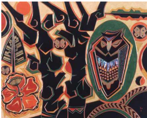
小口正二《戀の森》1997年 諏訪市美術館蔵