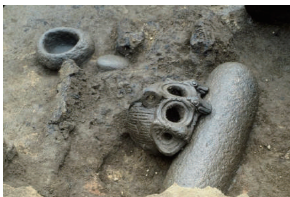
住居跡に残された遺物の状況

釣手土器は石棒に伏せてもたれるような状況で出土。石皿や石碗、深鉢土器も出土した。炭化有機質が広範囲にみられ、故意に火を用いた行為を行っていた可能性がある。