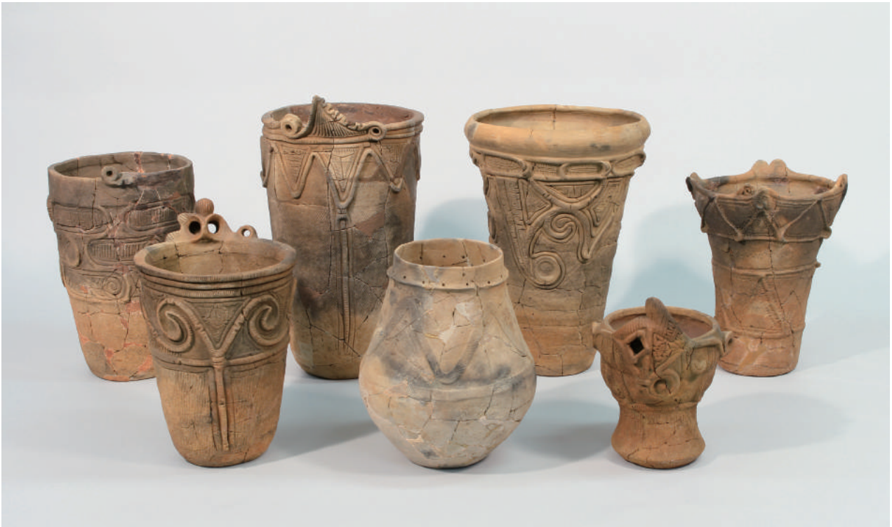
指定される縄文土器7点

1974年、中央自動車道西宮線建設に先立つ発掘調査で発見された縄文時代中期を中心とした市内屈指の大集落跡。狭い傾斜地に110軒以上の住居跡が検出され、多量の土器や石器が出土した。