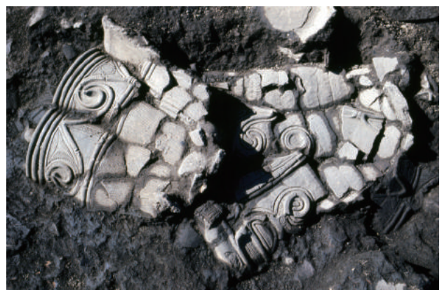
折り重なって潰れた土器