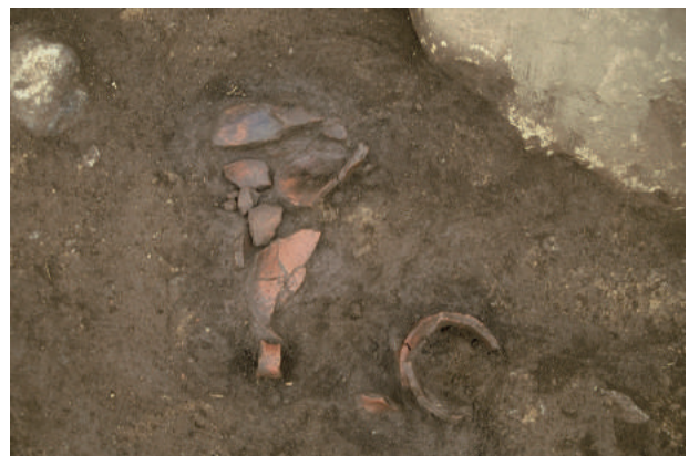
第7号住居跡と土器の出土状況