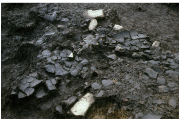
住居内に多量に残された土器群

（写真説明：指定番号は左上から時計回りに、27・23・24・28・26・22・25）