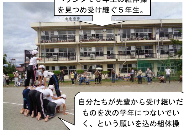
ベランダで6年生の組体操 を見つめ受け継ぐ5年生。

先週行われた体育学習発表会では、学年毎に目標をもち、それを達成できるように各学年取り組みました。練習の過程で意識してきたことはもちろん、終わった後も振り返りをしっかり行い、それをどの学年も次につなげようとしています。6年生は、学年集会での振り返りで、学んだこととして「自分の最初の一步が大事」「あきらめず全力でやること」「仲間と一緒にやること」「大きなことをやる達成感・成功させる楽しさ」…などを挙げ、次につなげることとして「協力 音楽会で音を合わせる」「助け合い 力を合わせる」「小さな事もがんばる」「一人じゃできないこともみんなと乗り越える」「挑戦」「努力」「失敗を恐れない」…などとまとめています。この先の子供達達の更なる成長が楽しみです。