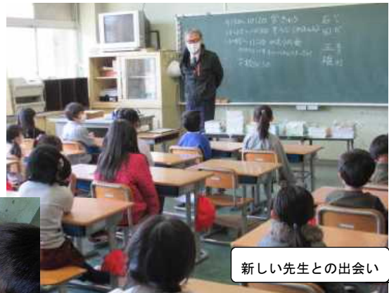
新しい先生との出会い