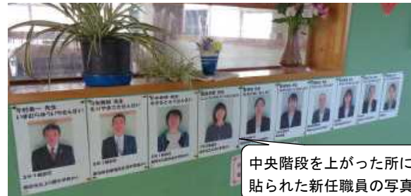
中央階段を上った所に貼られた新任職員の写真

になりたいという強い思いを抱いてのスタートでしたが、また休校ということで、保護者の皆様にも大変なご負担をおかけします。各学年から課題が出されておりますし、登校日を設けることや、1年生には家庭訪問もある旨連絡させていただきました。ご配慮よろしくお祈りします。休業中も検温はじめ健康チェックは行い、登校日の際にはカードの提出にご協力ください。