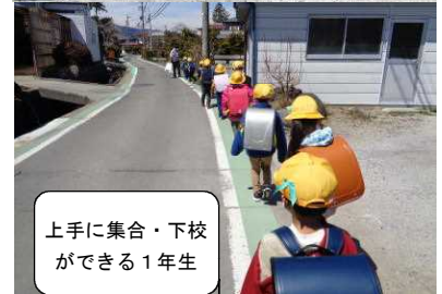
上手に集合・下校ができる1年生