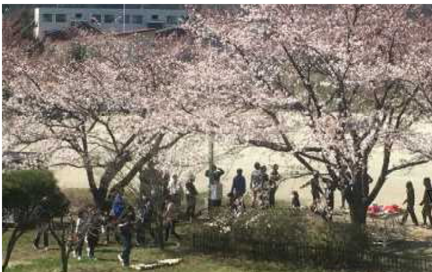
4月9日 「桜の下で遊ぶ6年生」

ふと見ると、あちこちで桜がきれいに咲いています。例年のようにそれをゆっくり楽しむこともできないことが大変残念ですが、また学校が再開できる日に備えて、中洲小職員みんなで子ども達・保護者の皆様のためにできることを考え、準備したいと思っています。様々な情報がとびかい不安は尽きないわけですが、今後ともご理解ご協力をお願い致します。