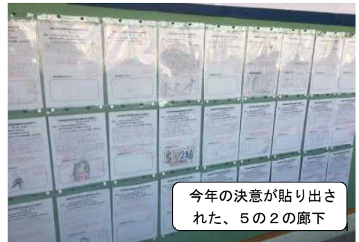
今年の決意が貼り出された、5の2の廊下

【登校日】 8:20~10:30 ※詳細は昨日配布 2・5・6年 4月16日(木)・22日(水) 3・4年 4月17日(金)・23日(木)