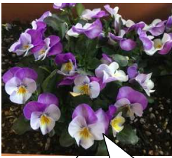
卒業式に間に合うように、きれいに咲いたパンジー