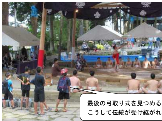
最後の弓取り式を見つめる6年生 こうして伝統が受け継がれていく

15日は秋のよいお天気に恵まれ、諏訪大社の奉納相撲が行われました。中洲に赴任したばかりの頃からこの行事のことは聞いており大変興味深かったのですが、感動の日でした。1～6年の子ども達がたくさん参加してカー杯の相撲をとっていたこともですが、約1ヶ月の練習の中で地域とのつながりを更に強め伝統を守る一人となっていることが素晴らしいと思いました。相撲踊りは、全国でも2カ所にしか残っていない貴重なもので、4本柱が許されている地方の土俵もここだけだそうです。諏訪の宝、いや日本の宝に触れる大変貴重な一日でした。