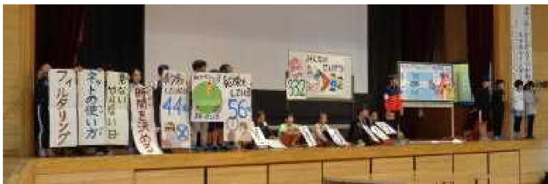
◆保健委員の皆さん、しっかり準備し素晴らしい発表をしてくれてありがとう！◆

最後は、メディア上のことに限らず、人として、苦手だとか嫌いだからと言っていじめたりしてはいけないこと、逆に人としてやってほしいことについて触れていただきました。かしこくメディアとつきあっていく方法をご家族で相談して、取り組んでみてください。