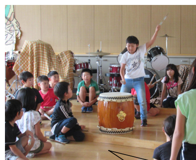
太鼓上達のために上手な友達のところをじっと見て、待っている時間にも進んで練習する3年生。

大縄クラスマッチが行われ、結果は2位でした。「がんばったね。」という私(担任)の言葉に納得いかない子ども達。「もっと練習していれば。」と後悔の声が。私からは「後悔するんだったら勝たなくてよかったね。満足いく練習をして勝てた方が気持ちいいね。」 これからを考えていく時間が一番大事だと思えます。 …いろいろな意見を出しながら、全員が首を縦にふるまで話し合いました。冬の大縄クラスマッチに向けて、週2回朝の時間に大縄の練習をすることにしました。(学級便りより抜粋)