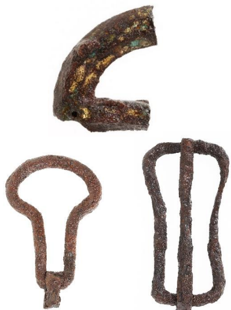
馬を飾る馬具の数々

諏訪市豊田にあった小丸山古墳の副葬品は、銀象嵌装大刀や小札甲 ぎんぞうがんそうたちら など、豊富な内容を誇ります。諏訪市教育委員会が進める保存処理事業のうち、平成30年度に処理が完了した遺物を公開します。 こぎねよろい