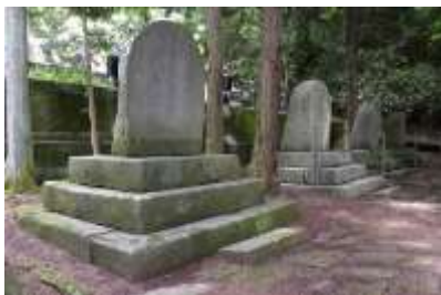
国史跡 高島藩主諏訪家墓所(温泉寺)

〒392-0027 長野県諏訪市湖岸通り 5-12-18 長野県 諏訪市教育委員会 生涯学習課 文化財係 (担当) 中川 聡史 電 話 0266-52-4141 (内線 582) F A X 0266-53-6219