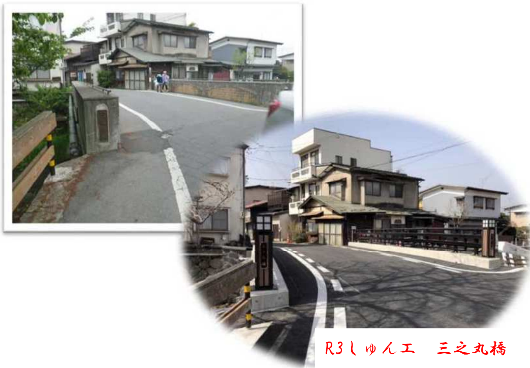
R3しゅん工 三之丸橋